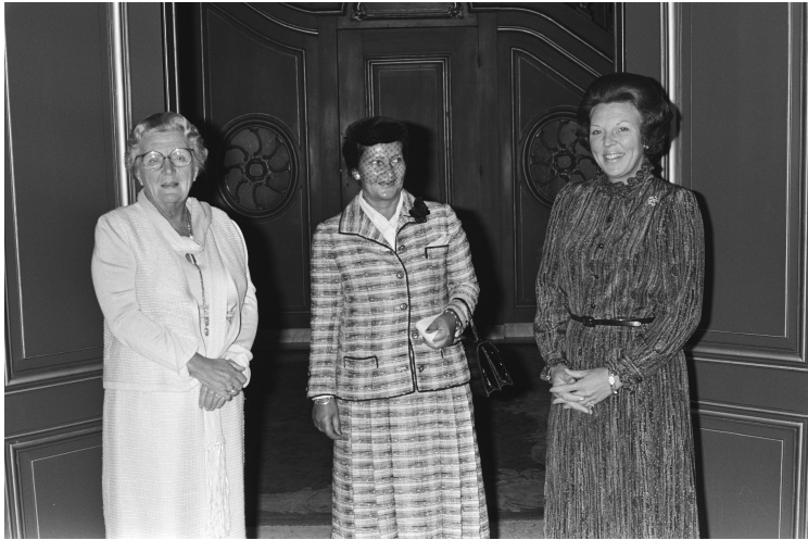
(La principessa Juliana, Simone Veil e la regina Beatrice, Rob Croes, Wikimedia) ,

«Per raccogliere le sfide lanciate all'Europa dovremo perseguire tre obiettivi: l'Europa della solidarietà, l'Europa dell'indipendenza, l'Europa della cooperazione. L'Europa della solidarietà anzitutto: della solidarietà tra i popoli, tra le regioni, tra le persone».