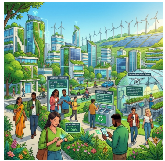
(Immagine generata con IA)

Costruire una città a misura di esseri umani significa quindi riconoscere la pluralità delle esperienze urbane e progettare spazi capaci di rispondere a bisogni reali e quotidiani. Ciò comporta maggiore sicurezza negli spazi pubblici, rafforzamento dei servizi essenziali, migliore qualità degli ambienti urbani e garanzia di un'elevata accessibilità per tutte le persone. In questa prospettiva lo spazio urbano diventa un luogo più equo, funzionale, inclusivo e ampio.